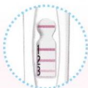
スコア3 (判定ライン3本)