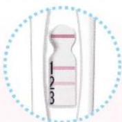
スコア2 (判定ライン2本)