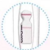
スコア1 (判定ライン1本)