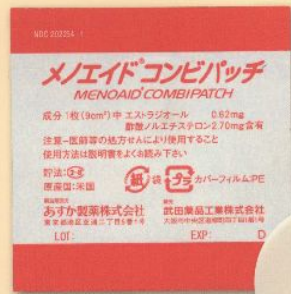
製品名 メノエイド® コンビパッチ 会社名 あすか製薬株式会社