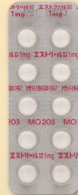
製品名 エストリール錠1mg 会社名 持田製薬株式会社