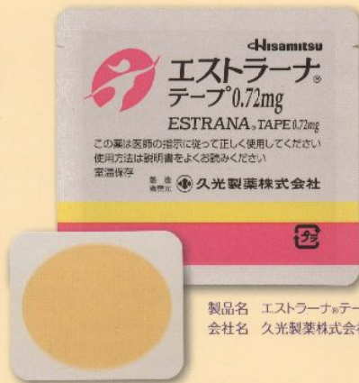
製品名 エストラナー®テープ0.72mg 会社名 久光製薬株式会社