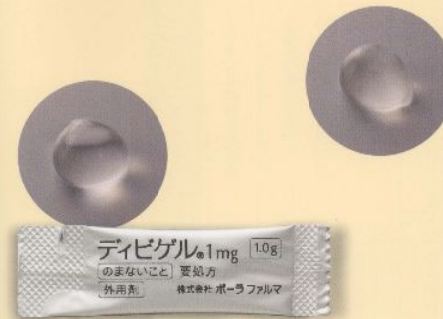
製品名 デイビゲル®1mg 会社名 株式会社ポーラファルマ 持田製薬株式会社