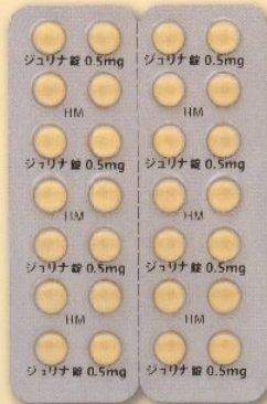
製品名 ジョリナ®錠0.5mg 会社名 バイエル薬品株式会社