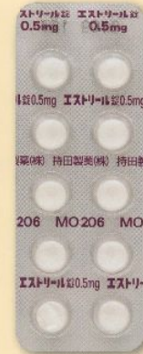
製品名 エストリール錠0.5mg 会社名 持田製薬株式会社