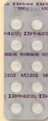
製品名 エストリール錠100γ 会社名 持田製薬株式会社